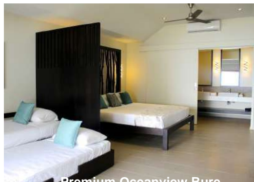
Premium Oceanview Bure